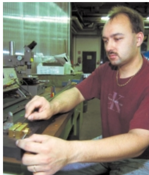
Wer ist Arbeiter, wer Angestellter? Gleichwertige Arbeit gleich bezahlen – ERA macht's möglich