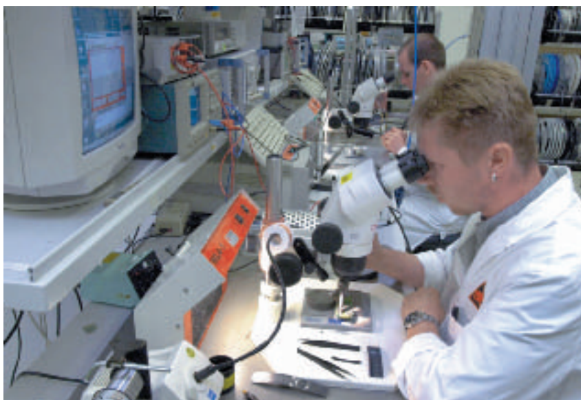
Handyfertigung in Leipzig: Was geleistet wird, kann mit den neuen Entgeltgruppen eindeutiger bewertet und gerecht bezahlt werden

Die Frage ist: Stehen Sachsens Metallarbeitgeber zu ihrem Wort und zu ihrer Unterschrift? Langsam kommen der IG Metall-Verhandlungskommission Zweifel. Denn während es in Sachsen noch nicht einmal ein Teilergebnis gibt, haben sich IG Metall und Arbeitgeber in fast allen Tarifgebieten der Bundesrepublik bereits über die Ein-