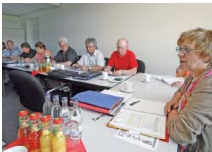
13. Juni in Berlin: Die Tarifkommission Stahl Ost kündigte die Lohn- und Gehaltstarifverträge.

In der jüngsten Tarifrunde für die Metallindustrie hat die IG Metall qualitative Forderungen durchgesetzt. Es ist eine Zukunftsfrage, tarifliche Voraussetzungen zu schaffen, dass die Beschäftigten gesund das Rentenalter erreichen. Dazu sind Ideen und Konzepte gefragt.