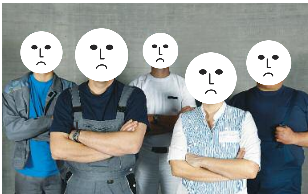
Beschäftigte auf Zeit neben uns: Direkt ausgeliehen? Sub- oder Sub-Sub-Leiharbeitskräfte? Werkvertrag? Zu welchen Bedingungen? Betriebsräte müssen mitreden

Das Ziel: Leiharbeit muss begrenzt und fair geregelt werden. Insbesondere geht es dabei um die Bezahlung, das Volumen und die Dauer sowie die Kriterien, nach denen eine Firma den Entleiher auswählt.