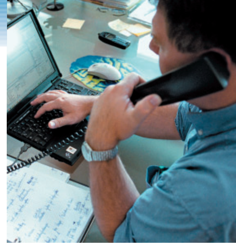
Herausgeber: IG Metall-Bezirk Berlin-Brandenburg-Sachsen. Verantwortlich: Olivier Höbel, Druckerei: apm AG, 64295 Darmstadt.

Selbstverständlich bekommen Sie auch alle anderen Leistungen der IG Metall, zum Beispiel Streikgeld oder die Freizeitunfallversicherung.