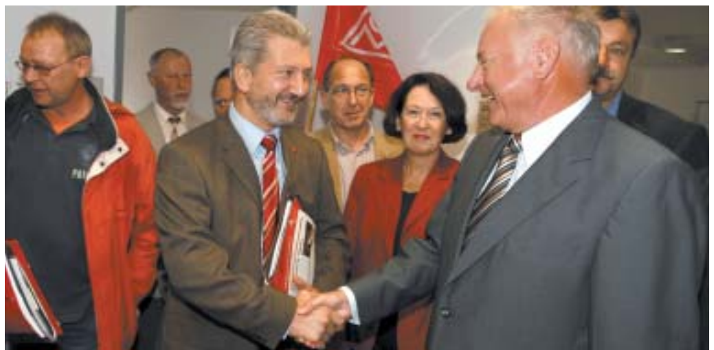
Beginn der Tarifverhandlungen in Berlin: Die Erwartungen der Beschäftigten sind hoch

Vor dem Hintergrund eines anhaltenden Booms der Branche fordert die IG Metall eine Anhebung der Löhne und Gehälter um sieben Prozent. Für die Auszubildenden will die IG Metall