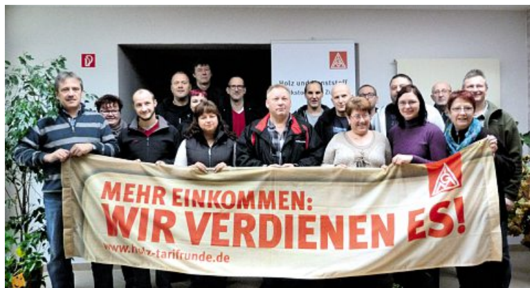
Kolleginnen und Kollegen der Holz- und Kunststoffindustrie: Der Tarifkonflikt hat begonnen.