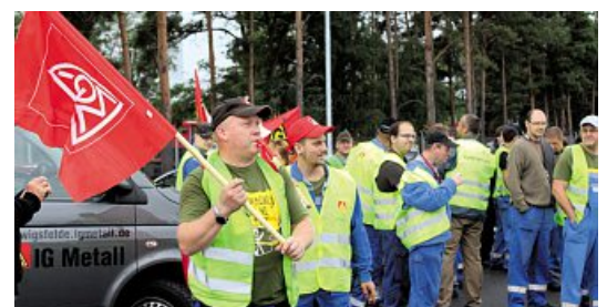
Klenk-Beschäftigte bei ihrem ersten Warnstreik im Juli 2015. Folgt jetzt der zweite?