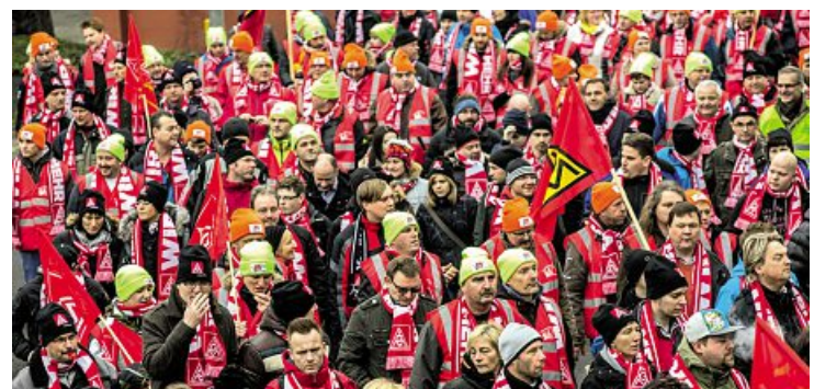
Impressionen vom Tarifauftakt 2015.