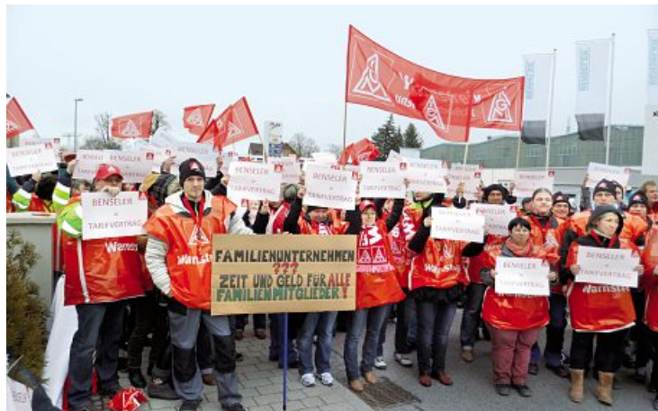
Warnstreikpremiere bei Benseler.

Warnstreik unser Recht »Warnstreik ist kein Kindergeburtstag. Warnstreik ist auch nicht Jux und Tollerei am Faschingsdienstag. Warnstreik ist unser gutes Recht. Dieser befristete Ausstand ist ein deutliches Signal an den Arbeitgeber: Kommen sie endlich an den