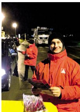
Flugblattaktion in Hennigsdorfer Elektrostahlwerken Ende Januar: Gegen neue EU-Pläne