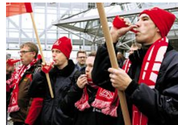
Warnstreik 2015 bei Rolls-Royce Dahlewitz.

Angleichung an Westen Abschließend wurde gefragt, ob es weitere Vorschläge und Anregungen gibt: Hier gab es aus mehreren Betrieben einen klaren Trend: »Die Arbeitszeit ist zu lang!«, »Angleichung an den Westen!« und »35-Stunden-Woche auch bei uns!«. Die Tarifangleichung der Arbeitszeit war auch Thema auf dem Gewerkschaftstag im Oktober. Die IG Metall will es angehen. Aber noch nicht in diesem Jahr.