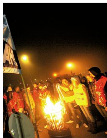
Arcelor-Mittal Eisenhüttenstadt zur Aktionswoche: Billigimporte gefährden Stahlarbeitsplätze.

Neue EU-Pläne zum Handel mit CO 2 -Emissionen trieben Stahlwerker Ende Januar zu einer Aktionswoche bundesweit vor die Werkstore. Der Vorwurf: Brüssel gefährdet durch Überregulierung und die Gestattung von Billigimporten deutsche Stahlarbeitsplätze. Auch Metallerinnen und Metaller von Arcelor-Mittal Eisenhüttenstadt und den Hennigsdorfer Stahlwerken machten demonstrativ auf den fatalen Konflikt aufmerksam: Die EU will mit verschärften Emissionsregeln zum Klimaschutz beitragen. Am Ende könnte die Reform aber nicht nur Arbeitsplätze vernichten, sondern den CO 2 -Ausstoß weltweit sogar erhöhen. Der Mechanismus: Lassen sich Stahlwerke wegen milliardenteurer Emissionsbestimmungen in Europa nicht mehr wirtschaftlich betreiben, werden sie früher oder später schließen. Stahl wird aber weiterhin gebraucht. Europa müsste seinen Bedarf dann komplett über Importe decken – zum Beispiel aus China, dem weltweit größten Stahlproduzenten. Chinesischer Stahl belastet das Klima viel stärker als europäischer. In Deutschland fallen dank technologischer Innovation für eine produzierte Tonne Stahl 1,5 Tonnen CO 2 an. In China sind es 1,8 Tonnen.