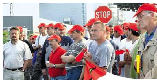
2006: Pfeilerer-Kollegen waren damals die ersten, die in Baruth einen Tarifvertrag durchsetzten.

Spätestens, wenn sich die Belegschaft nach einem Aufruf der IG Metall vor dem Tor versammelt, ist die Zuständigkeit geklärt!