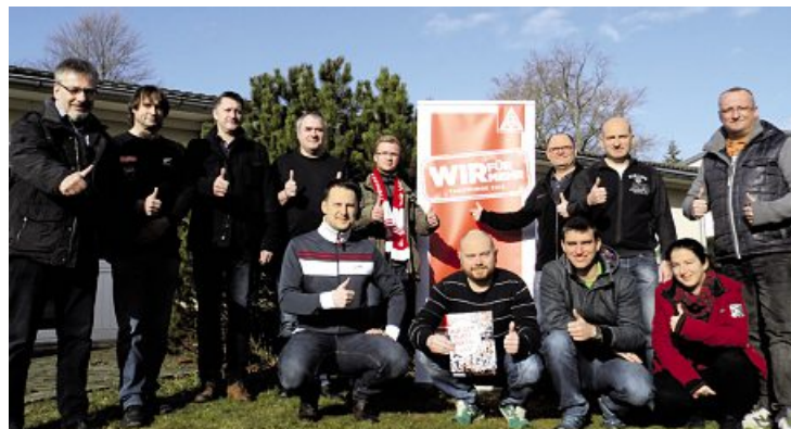
»Wir für mehr« bleibt das Motto unserer Vertrauensleute.

Das nächste Projekt ist der Tarifauftakt des Bezirks in der Tarifrunde 2016. Aktuell mobilisieren die Vertrauensleute in den Betrieben für den 12. März in Leipzig. Dort wollen sich die Metallerrinnen und Metaller für die Tarifaueinandersetzung in der Metall- und Elektroindustrie in diesem Jahr warm laufen.