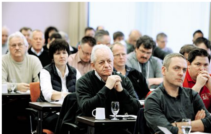
Ende Januar: Die Metall-Tarifkommissionen beschäftigten sich eingehend mit den wirtschaftlichen Kennzahlen.