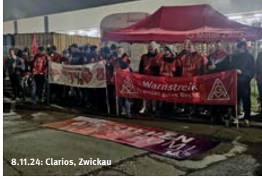
8.11.24: Clarios, Zwickau