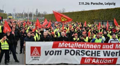
7.11.24: Porsche, Leipzig