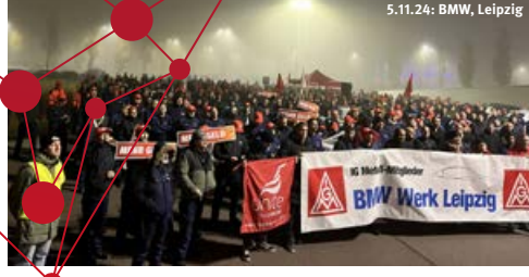
5.11.24: BMW, Leipzig