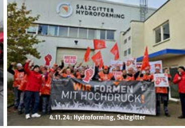
4.11.24: Hydroforming, Salzgitter