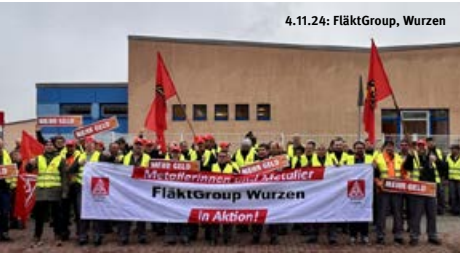
4.11.24: FläktGroup, Wurzen