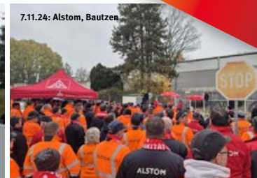
7.11.24: Alstom, Bautzen