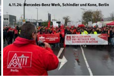
4.11.24: Mercedes-Benz Werk, Schindler and Kone, Berlin