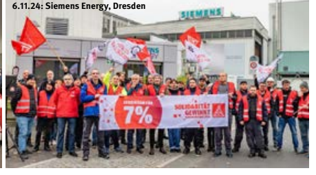
6.11.24: Siemens Energy, Dresden