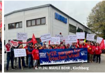
6.11.24: MAHLE BEHR, Kirchberg