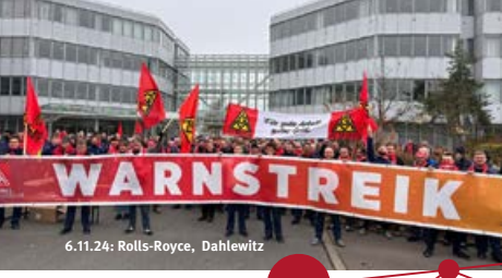
6.11.24: Rolls-Royce, Dahlewitz