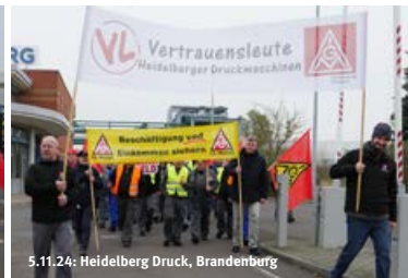
5.11.24: Heidelberg Druck, Brandenburg