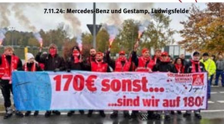
7.11.24: Mercedes-Benz und Gestamp, Ludwigsfelde