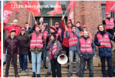
7.11.24: Bosch digital, Berlin