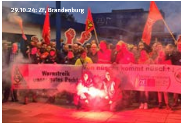
29.10.24: ZF, Brandenburg