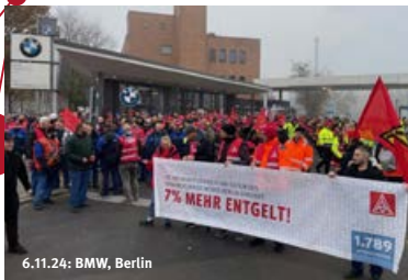
6.11.24: BMW, Berlin