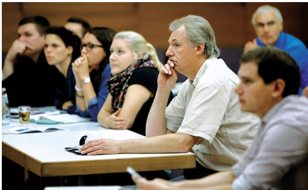
Konzentrierte Diskussion: Wir wollen mehr! Entgelt, Bildung, Altersteilzeit

Am 25. November beschließen alle Tarifkommissionen bundesweit die Forderung für 2015.