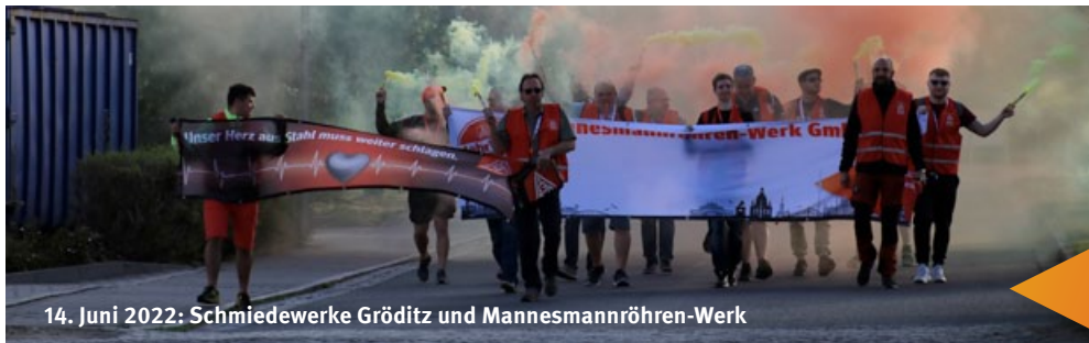
14. Juni 2022: Schmiedewerke Gröditz und Mannesmannröhren-Werk