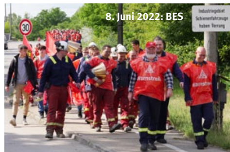
8. Juni 2022: BES