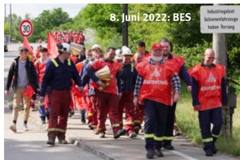
8. Juni 2022: BES