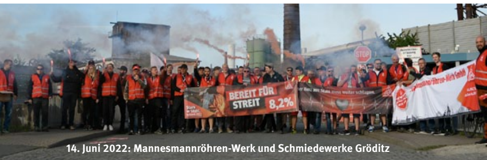
14. Juni 2022: Mannesmannröhren-Werk und Schmiedewerke Gröditz