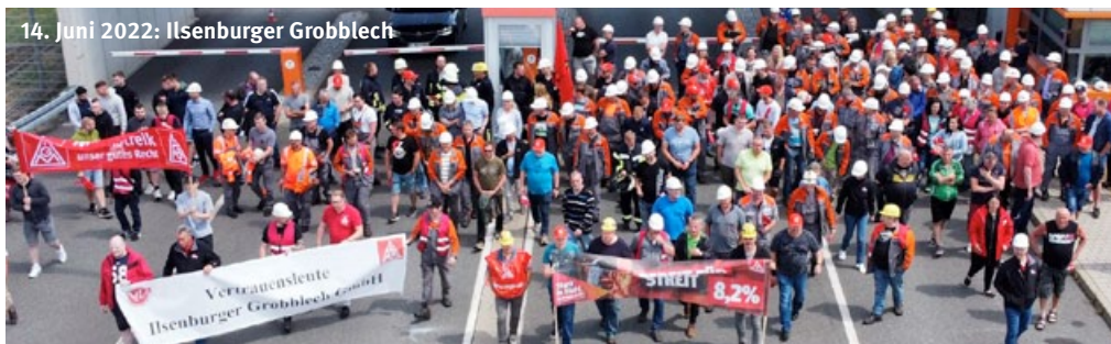
14. Juni 2022: Ilseburger Grobblech