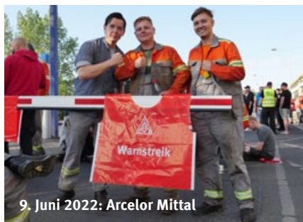
9. Juni 2022: Arcelor Mittal