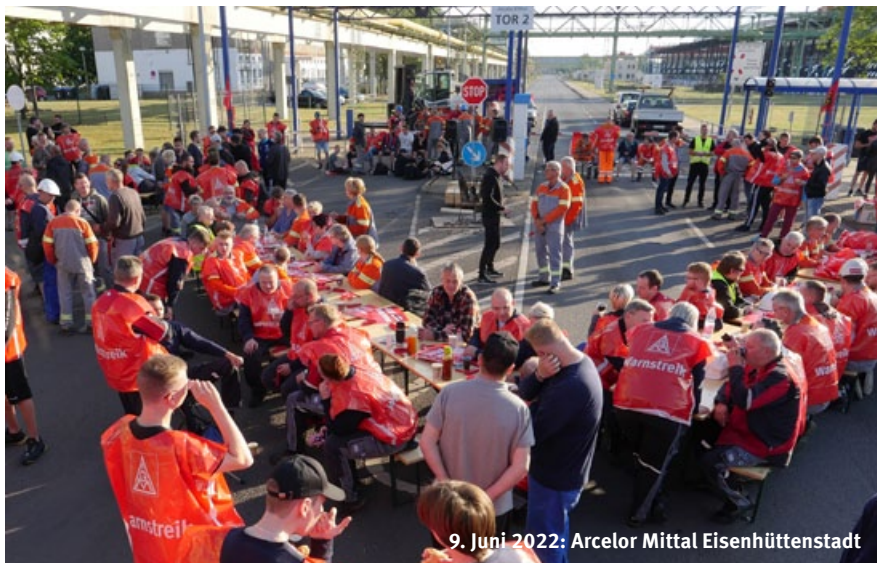
9. Juni 2022: Arcelor Mittal Eisenhüttenstadt