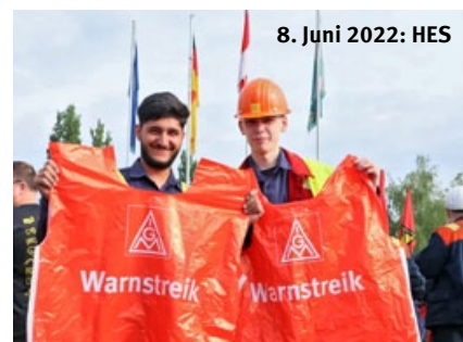
8. Juni 2022: HES