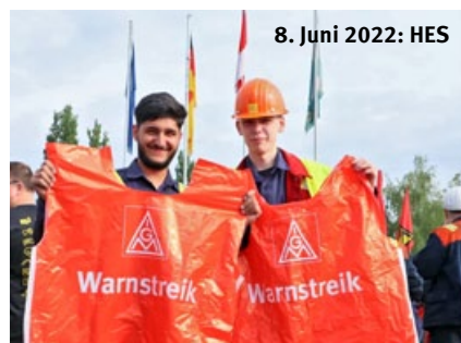
8. Juni 2022: HES