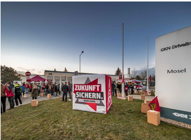
23.4. | GKN Driveline Deutschland