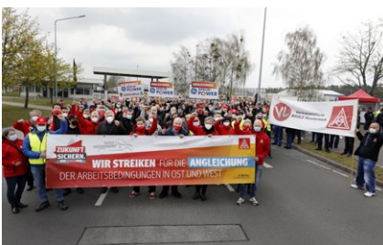
29.4. | Mercedes Benz Ludwigsfelde