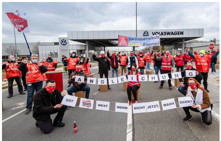
23.4. | VW Sachsen