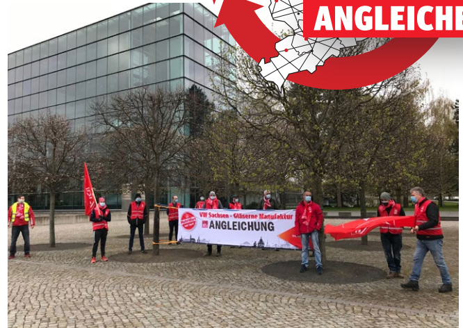
23.4. | VW Gläserne Manufaktur